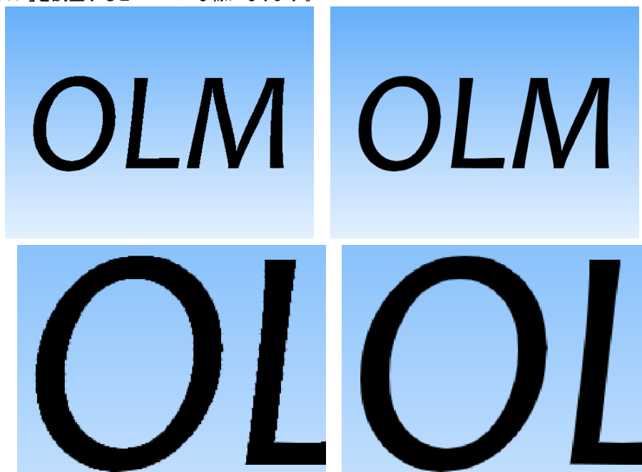
図 4 (左)Smooth =0(右) Smooth=6、(下段)はそれぞれの拡大図 右画像のラインの方がスムーズなのが分かります