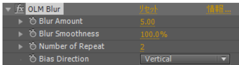
図 2 OLM Blurエフェクトのパラメータ