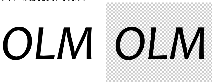
図 3 (左)Use Color Keyオフ(右)Use Color Keyオン オンの時はチェッカー模様が見えています