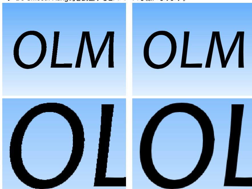
図 4 (左)Do Smooth Range=0(右) Do Smooth Range=6、(下段)はそれぞれの拡大図 右画像のラインの方がスムーズなのが分かります